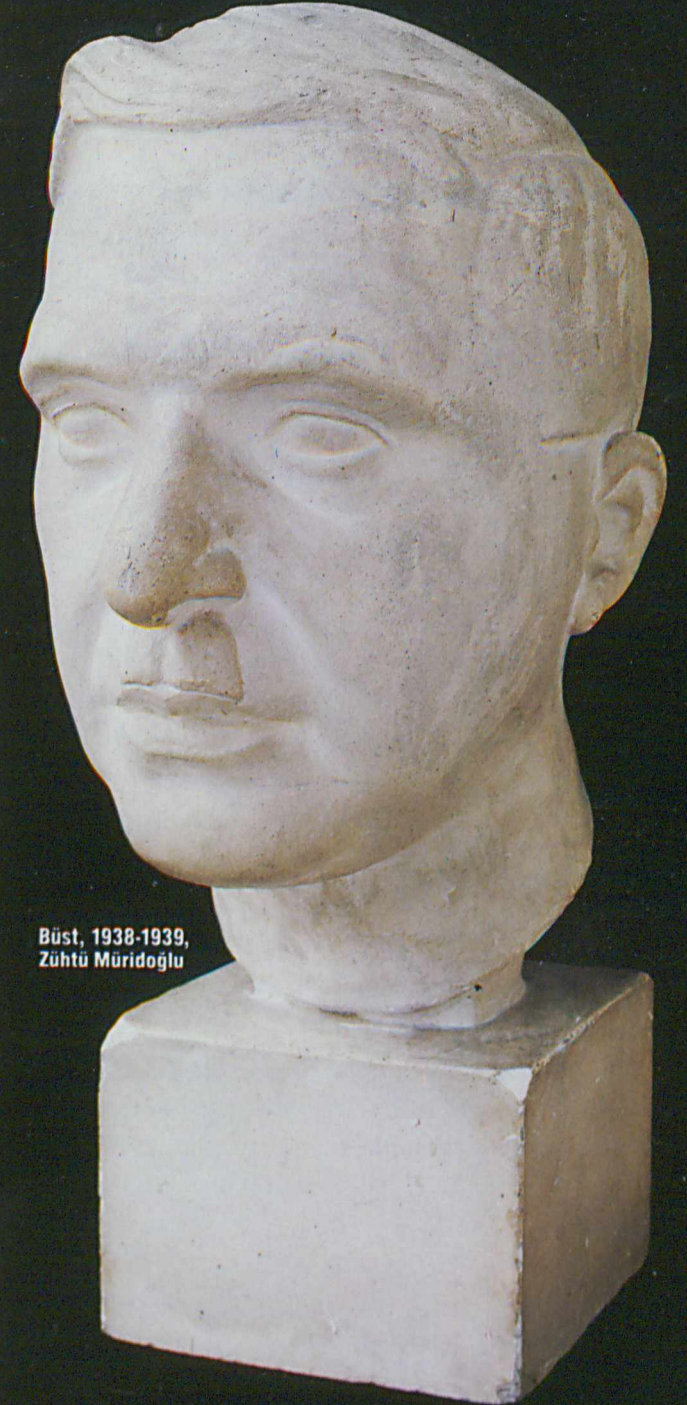
Büst, 1938-1939, Zühtü Müridoğlu

Doğumunun 100. Yılında Yapıtları Sergisi