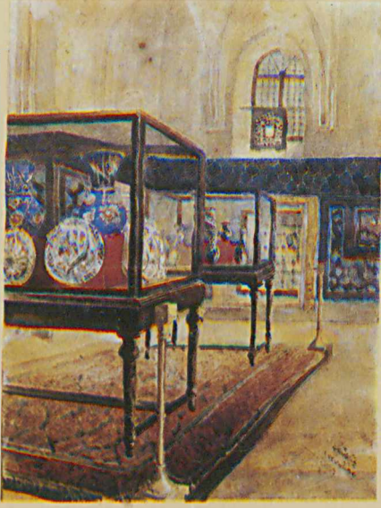
Çinili Köşk, Enteryör