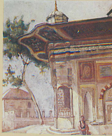
3. Ahmet Çeşmesi

Ressam Aziz Ogan'ın yapıtlarında ise hocası Osman Hamdi'nin, atölye arkadaşlarının ve devrinin etkisi görülmektedir. Arkeolojik buluntular ve doğa, yapıtlarının konusunda etkin olmuştur. Ege'nin parlak güneşi, aydınlık renkleri peysajlarında bütün canlılığı ile yer almıştır.