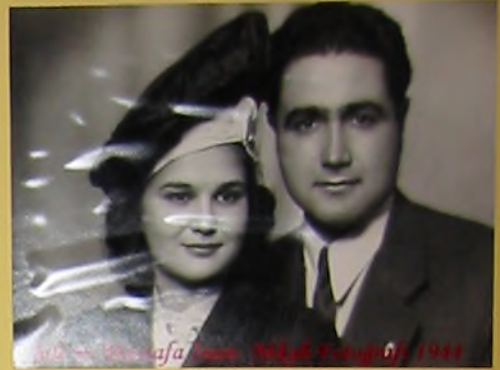
...aşağıda ... 1944