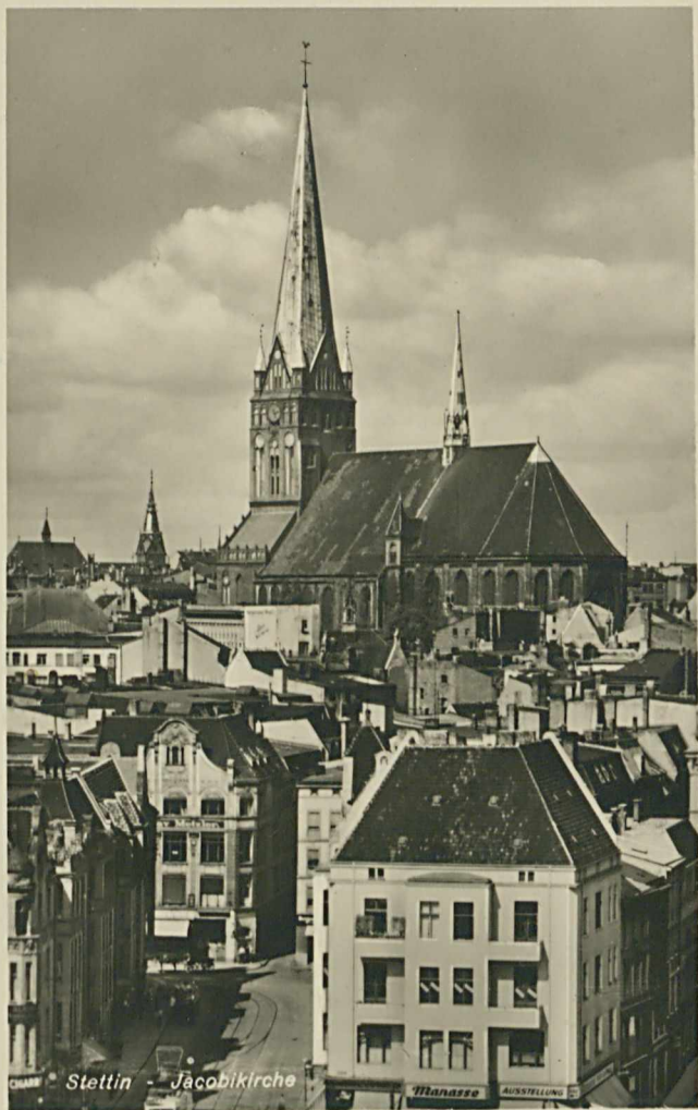
Stettin - Jacobikirche