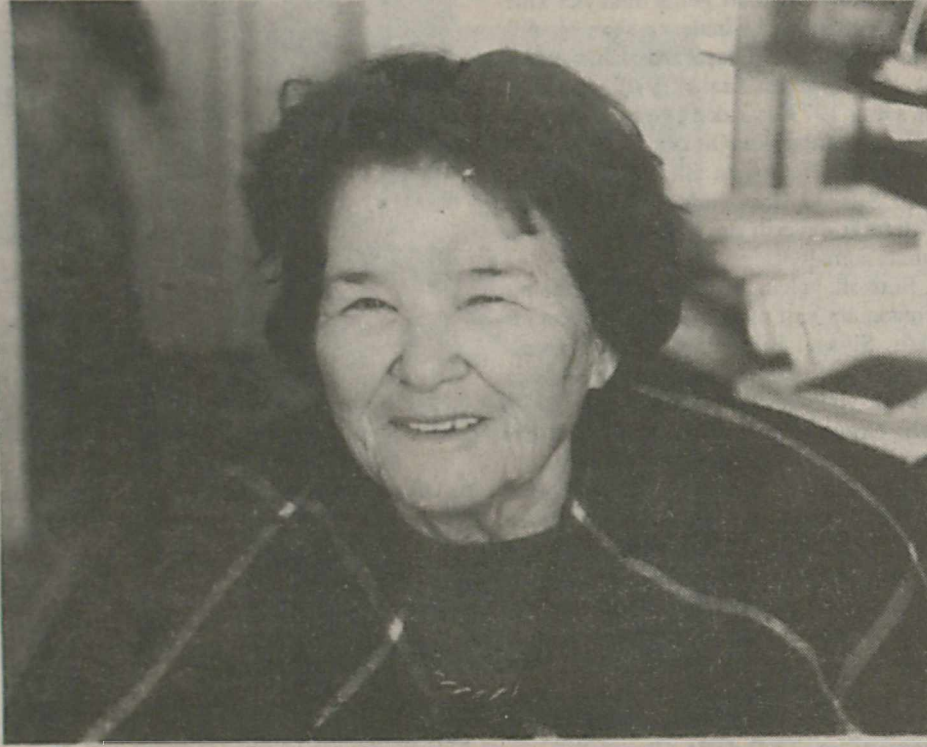
Prof. Dr. Jale İnan. Türkiye arkeolojisine büyük emekleri geçti.