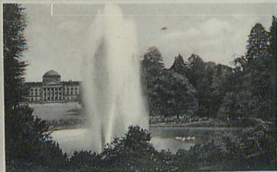
Fontäne und Schloß

mit ihren überragenden Kunstabauten und Schlössern ✱