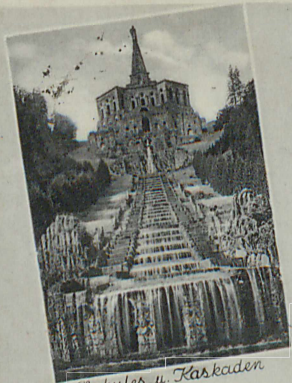
Herkules u. Kaskaden