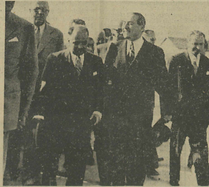
Başbakan Yeşilköy hava alanında karşılanırken

Washington, 29 (YİRS) — Dış İşleri Bakanı John Foster Dulles mahalli saatle 16.28 de, 12 Orta ve Yakınoğu memleketlerine yapmış olduğu üç haftalık seyahatten dönmüştür.