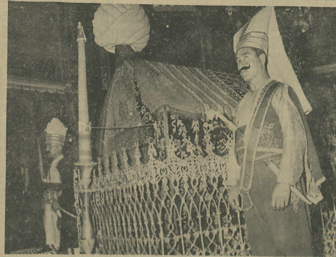
Fatih'in Türbesinde ihtiram duruşu yapan Yeniçeriler

Kars, 29 (ANKA) — Dün gece yağın şiddetli yağmurlardan şehir tamamen sel tehlikesine mâruz kaldığı bir sırada istasyon civarındaki petrol ambarına bir yıldırım isabet etmiş ve ambar da mevcut bulunan 30 bin varil gaz ve benzin infilâk etmiştir. Patlama neticesinde halk büyük gürültülerle uyanmış, istasyon ve civarı tamamen yangın yerine dönmüştür. İtfalye varka mahalline gelerek yangını söndürmeye çalışmışsa da muvaffak olamamıştır. Karsın 20 ye yakın mahallesi durulamıyacak kadar tehlikeli olduğundan halk şehri tamamen terketmek üzere civardaki yaylalara müteveccihen ayrılmıştır. Alev ve dumanlar civar köylerden görüldüğü için köylüler "Kars yanıyor" diye yola çıkmışlar ve civar ilçeleri haberdar etmişlerdir. Halkın hâlâ şehri terket-