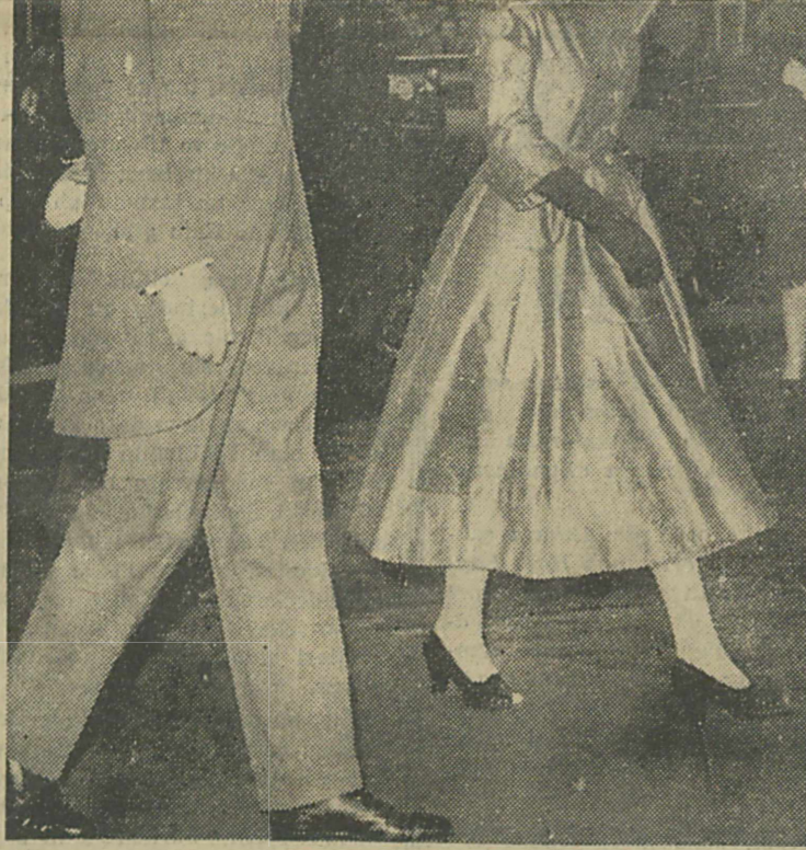
Resimde 2 Haziranda taç giyme merasimi yapılacak olan Kraliçe Elizabeth Parlâmentoya giderken görülüyor.

Her okuyucuya gazete-ye takip ettiği aya göre Banka ikramiyeye hesap numarası verilecektir. Şu kadar ki kendisine ikramiyeye isabet eden okuyucumuz ikramiyeye çıktığı güne kadar gazete-ye takip eylediğini kupon veya aboneliyle tevsih mecburiyetindedir.