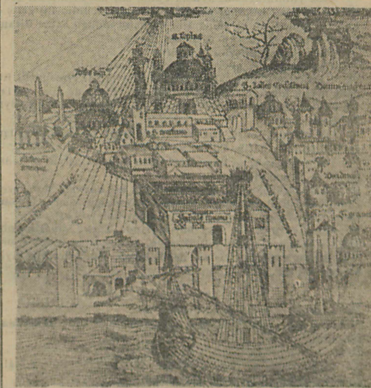
Ayasofya ve Atmeydanının denizden görünüşü (1493 te yapılmış bir krokidir)

Fetih hikâyesi, kısa bir zamanda Türk kuvvetlerinin İstanbul gibi muazzam bir kaleyi alacak bir seviyeye gelişmiş olduğunu, umumi efkârın da ne kadar azimli olduğunu gösteriyor. Kara kuvvetlerinin gelişmesini adım adım tâkib edebiliyoruz. Fakat İstanbul fethinde en büyük rol oynayan Türk denizciliğini o zamanki durumu ve süratli gelişmesi üzerinde çalışmamız icâbeden bir tetkik sahasıdır.