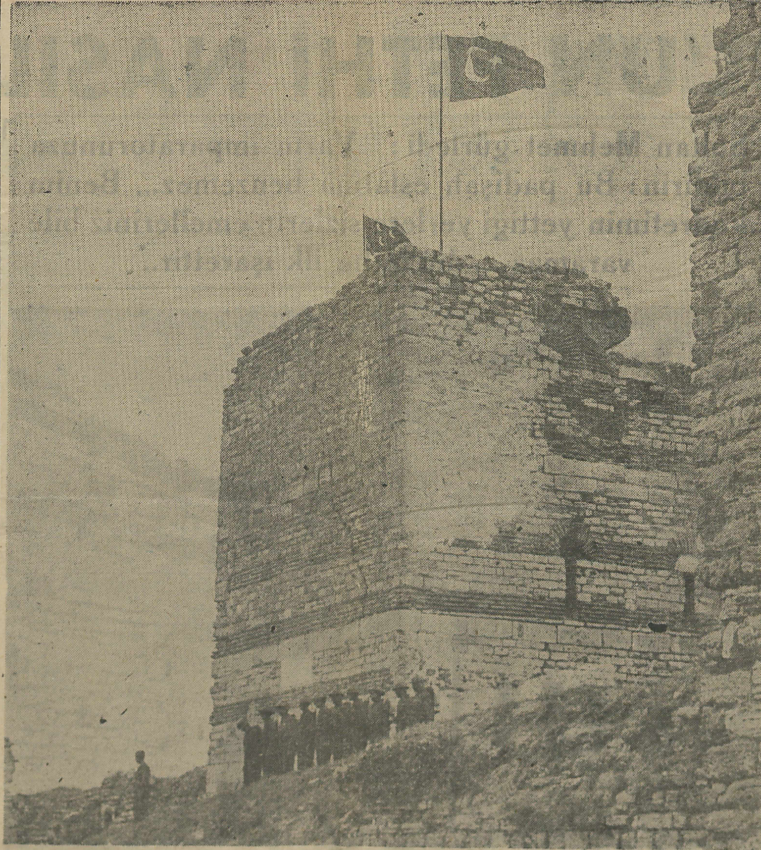
Ulubatlı Hasan'ın surlarda üstüne Fatih'in bayrağını diktiği kule

Yalnız bütün bu ihtisam, geçkin bir kadının süslenmesi kabilindendi. Dış yaldızlı, fakat iç boştu. Ve tahtın oturduğu temel tamamen çürümüşüdü.