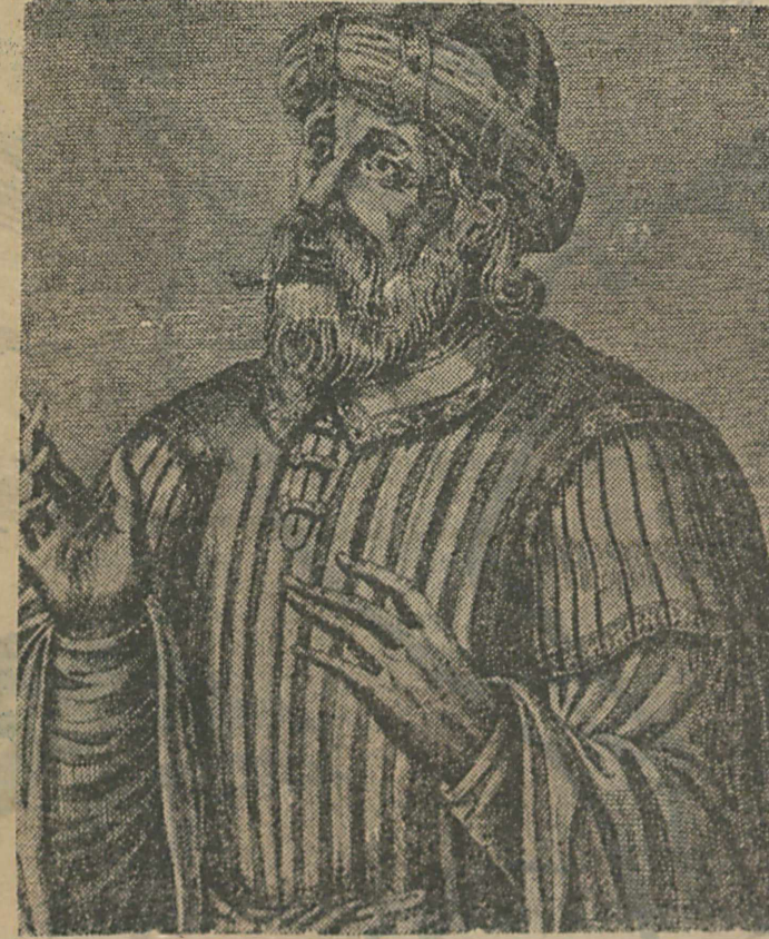
Son Bizans Kayseri Kostantin.

İ ki yıl aralıkla iki şehirde, iki hükümdar, iki hükümetin başında iki tahta oturmuşlardı.