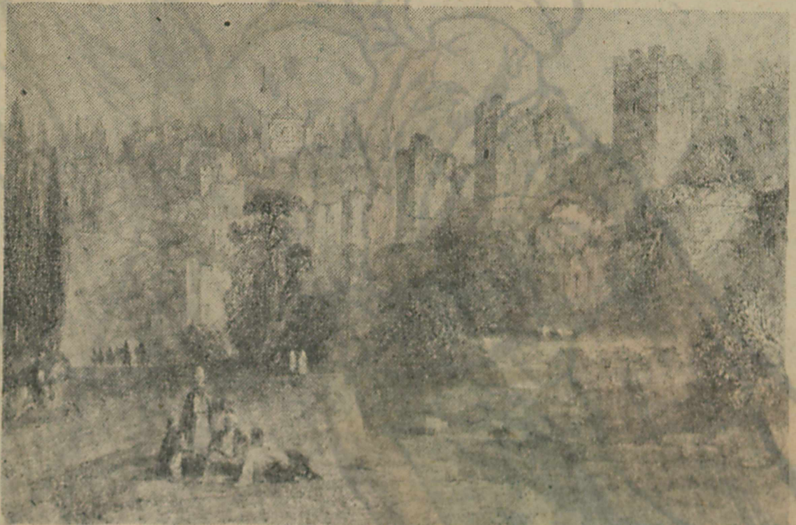
İstanbul surlarını fethinden sonraki gösteri bir tablo.

İlk defa kendini Rum İliminin Sultanı olarak ilân eden Yıldırım Beyazıt, eski ticaret yollarının canlanması