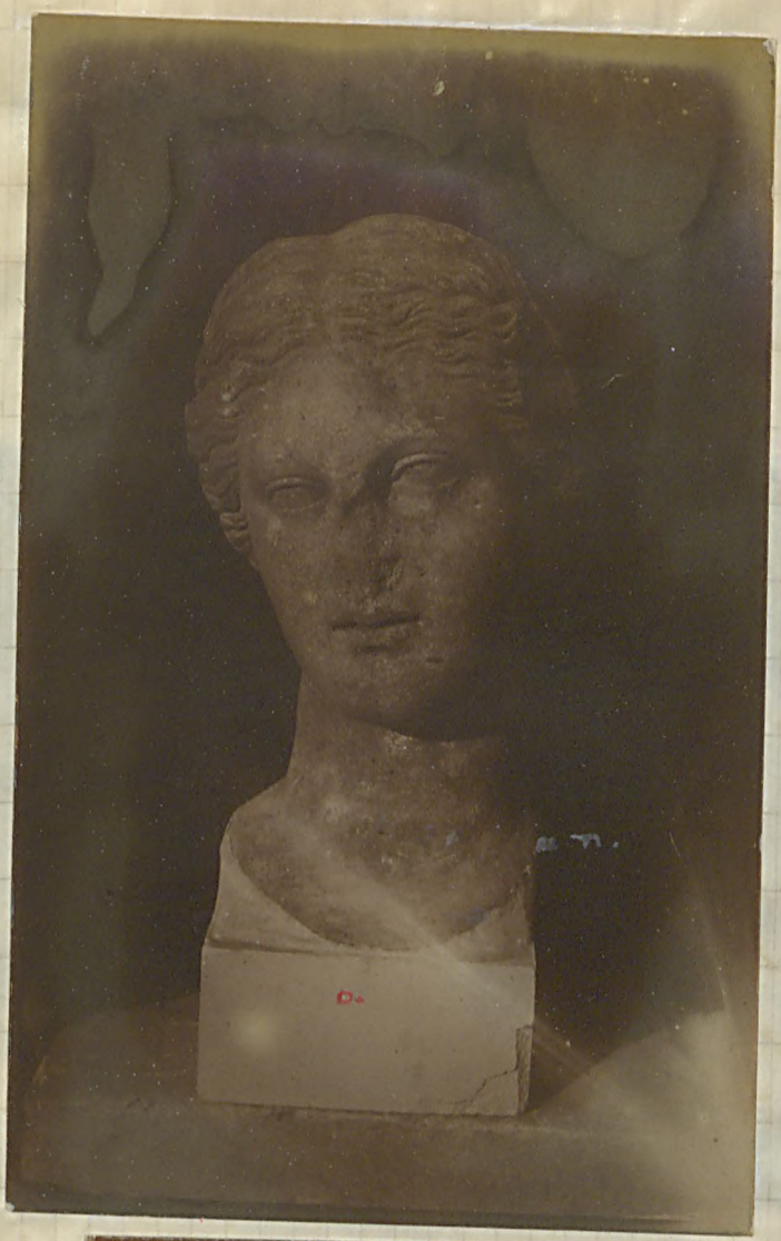
از موزه سنجیدگی