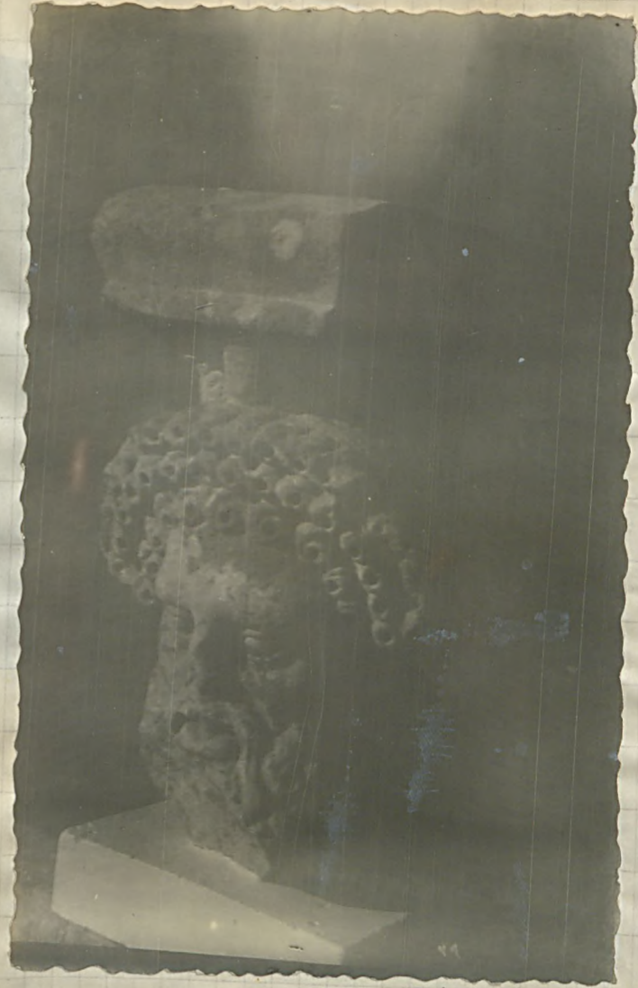
نمود ۲۹ بر موزه سنجلی -