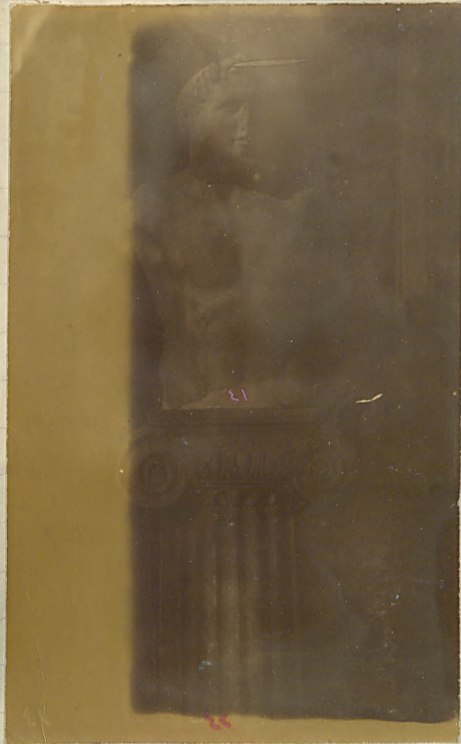
از میرموزه سنه جیلد ایستاد . شماره ۱۰۰۰۰