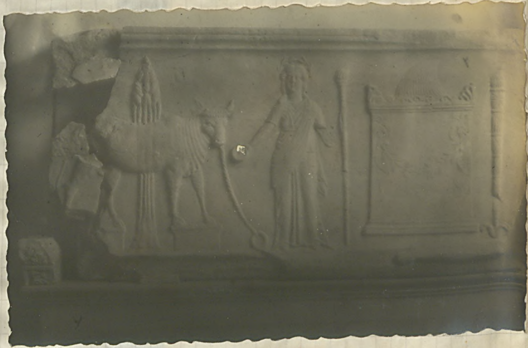
۲۱ نقشه ده لیلی