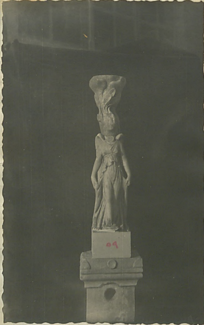
از مجموعه مجسمه‌ها