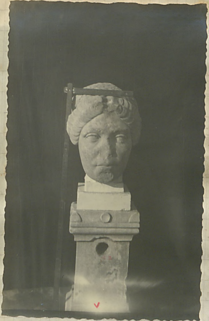
از مجموعه مجسمه‌ها