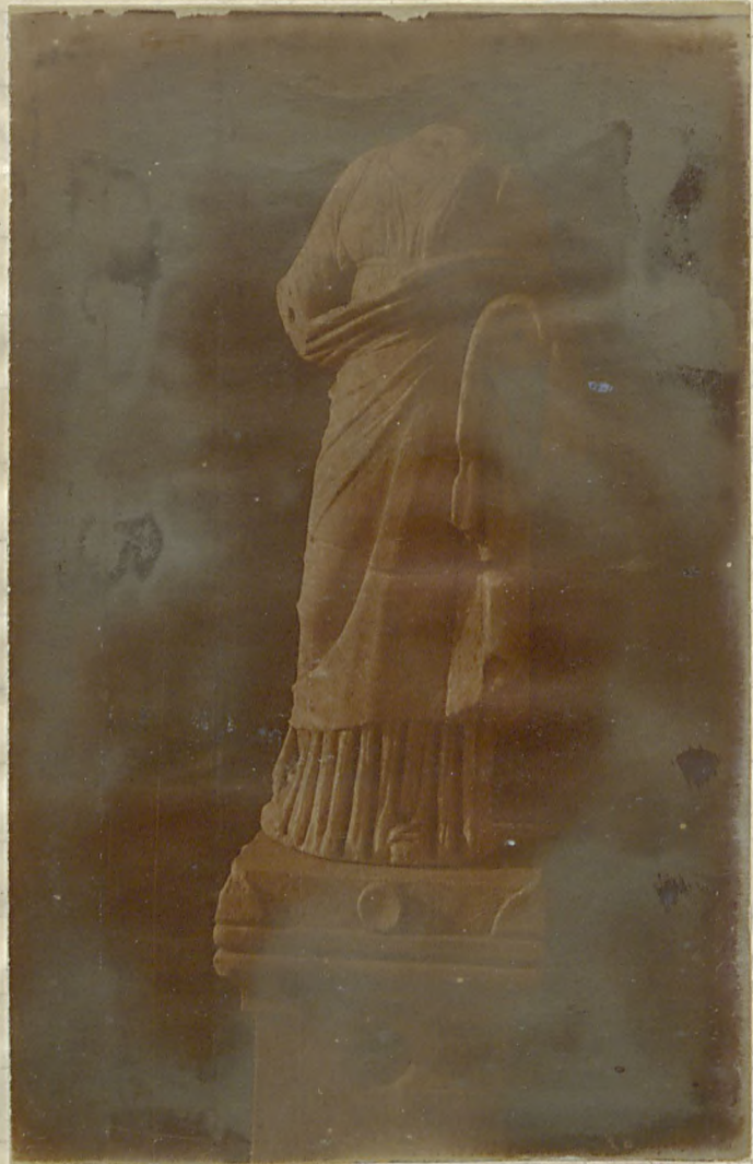
از میرموزه سنه جیلد ایستاد . برقم ۱۰