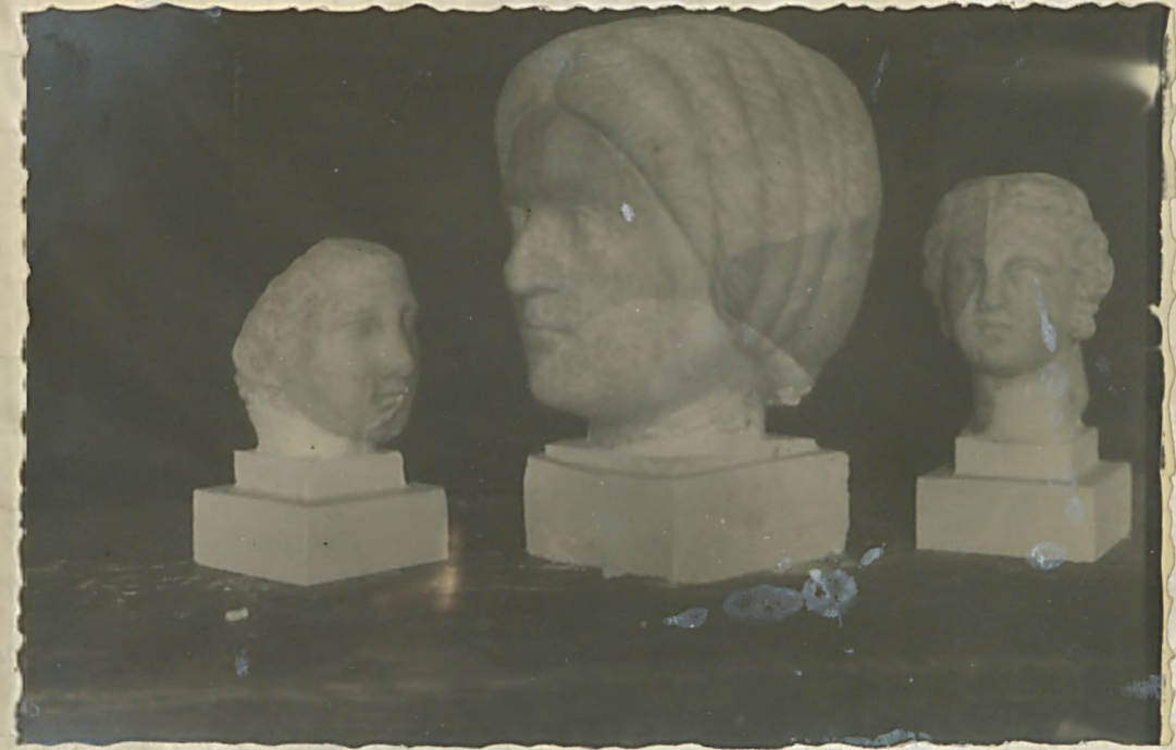
زردلو و باستان از میر موزه سید علی ایستاده