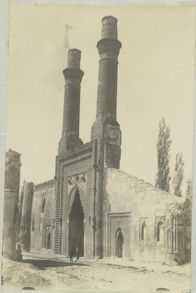
سیراس : اناقسن مار اسلاردن هفت مناره گه