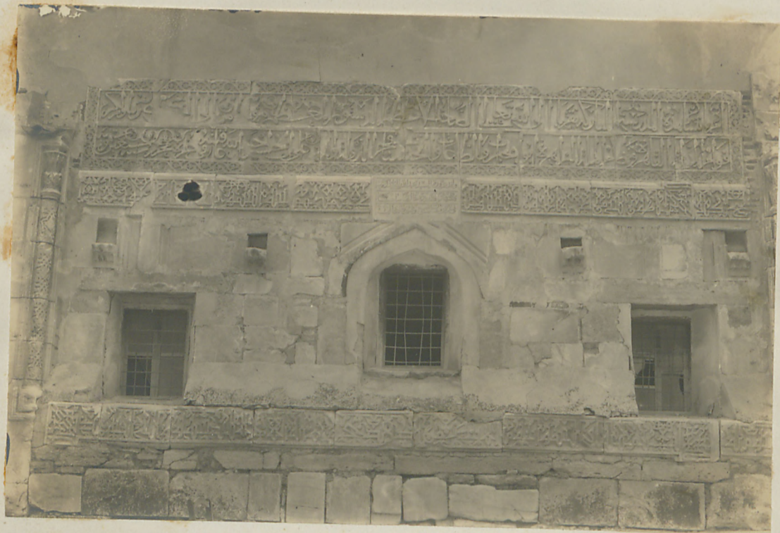
سیواس : کول مدرسه ده ستوره ایشانه کتاب لریک