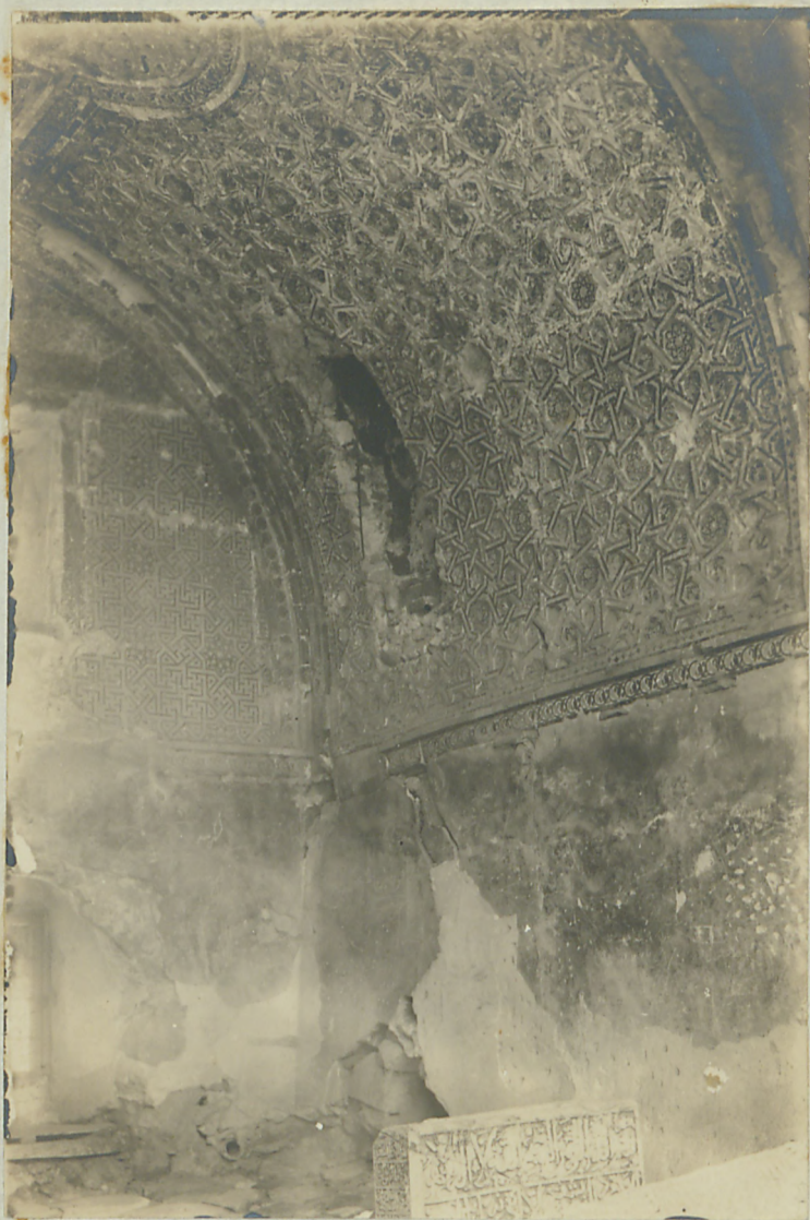
کون مدموده واقفدده بر نیک میسارله صع رداق