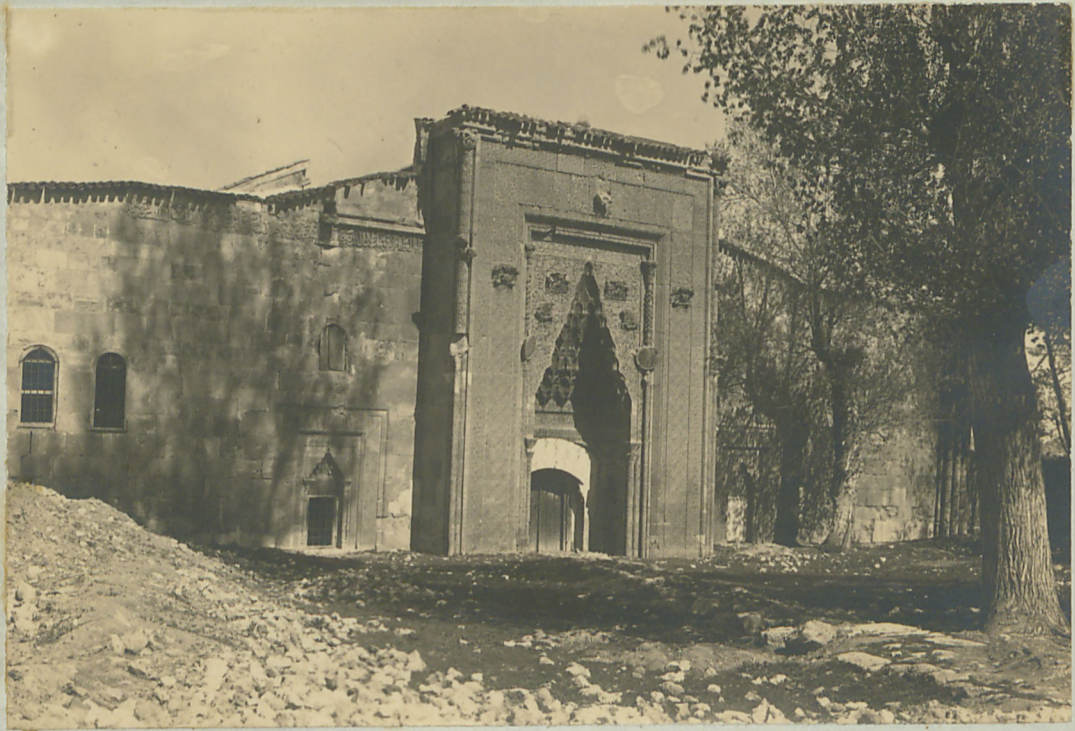
سیراکی : برویه دره سیراکی معنی اطاقه ک