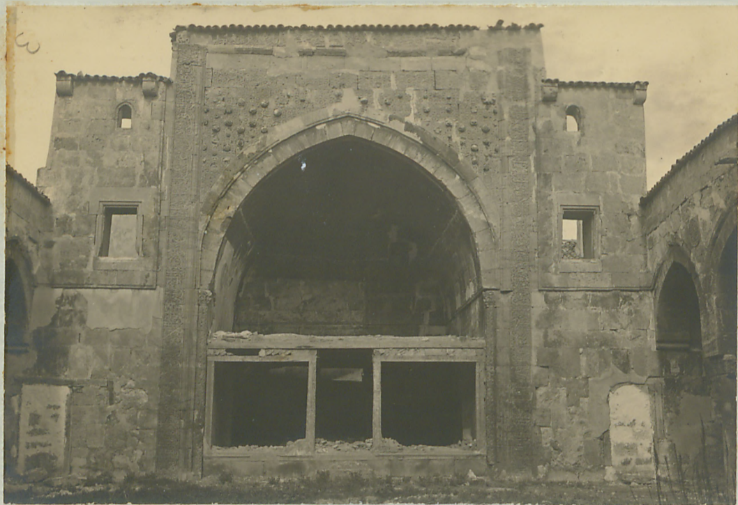
پارس - بردجم - دروازه قدیم پارس