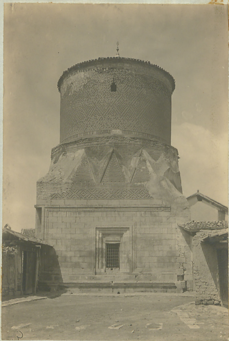
پلاز : کودورک مناره