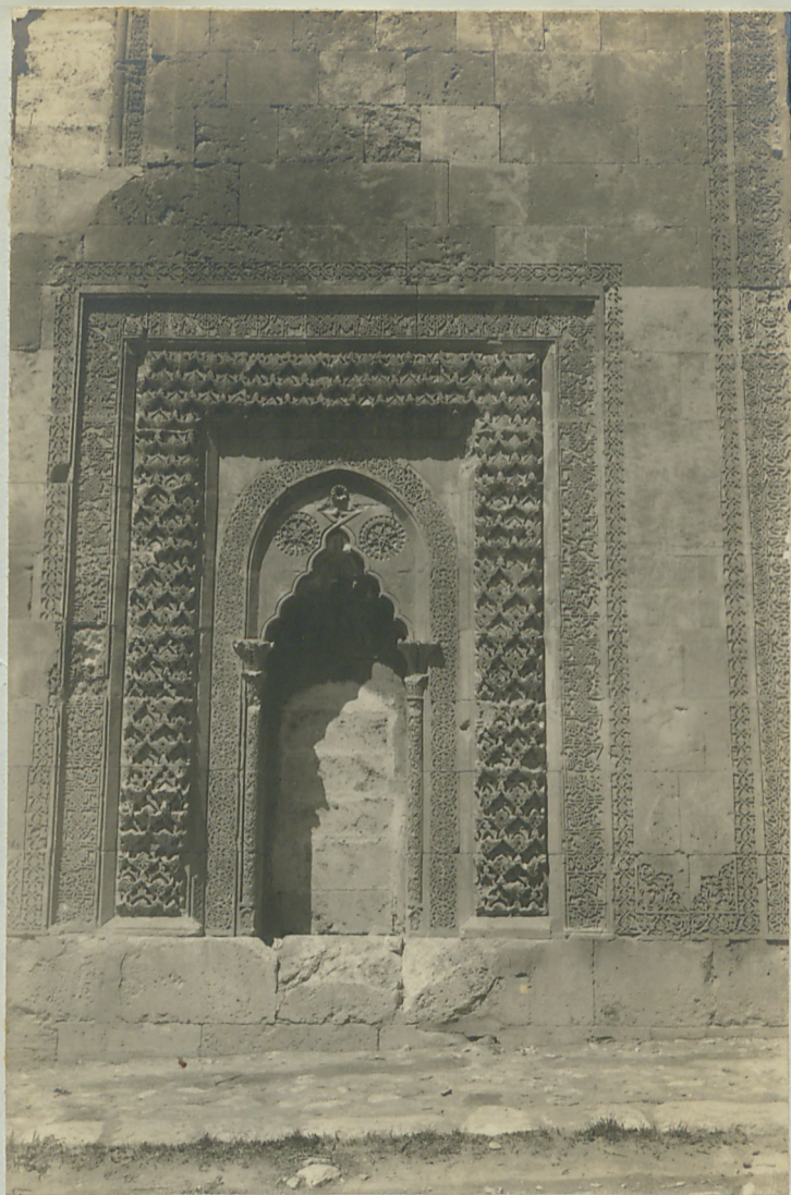
سیواس . حقیقہ مبارکہ لڑنام بنانہ ادرسہ سیدہ صفیہ بنت علی