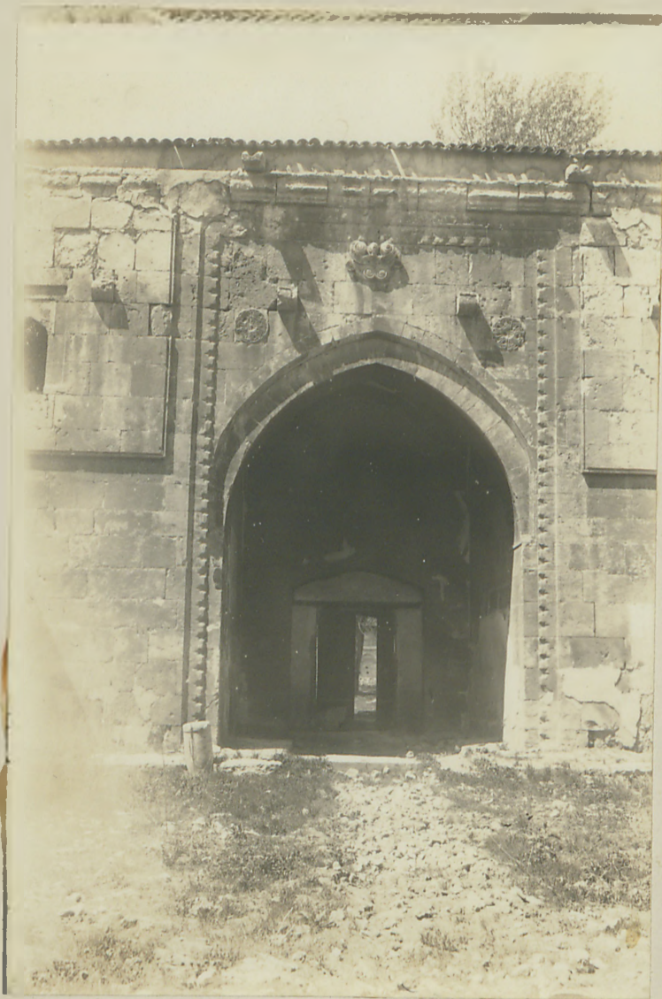
پوراسی بردیج مدرسینده قاپویم طوغری آلمشه توغری آلمیسی