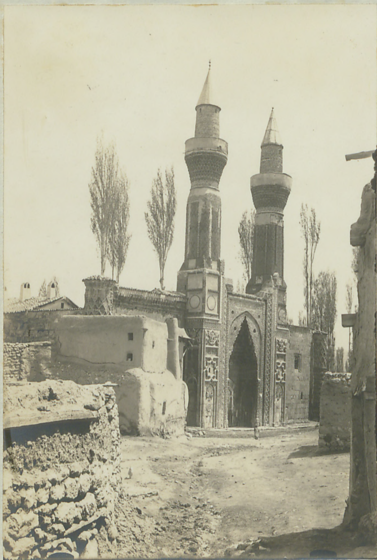
سیوس : موزه اتحاد ایریرده کورک مدرسه نیا سنک ادزاقده کوروشی