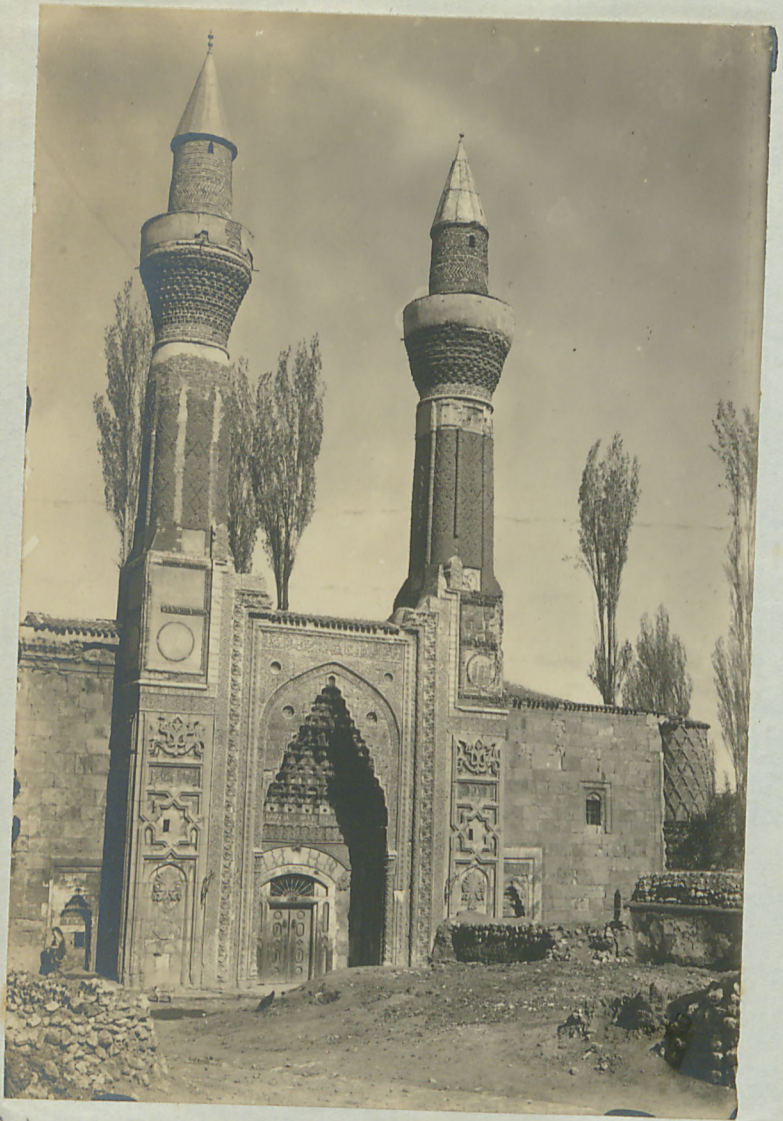
سجستان، موزه آثار ایلدیر کون در سه فتح یقینه کوردنیسی