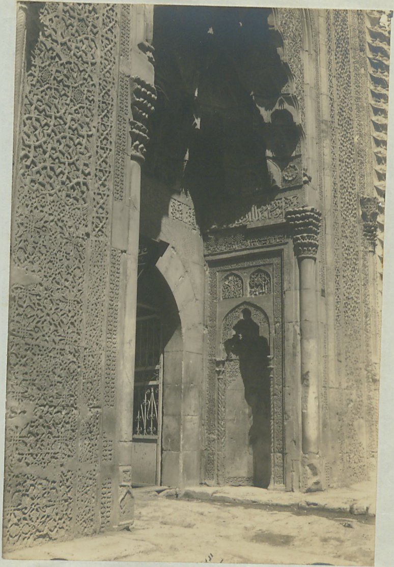
بیاض - مسجد شماره ۱۰۰ نام جامع بود محلته ای بسیار قدیمی .