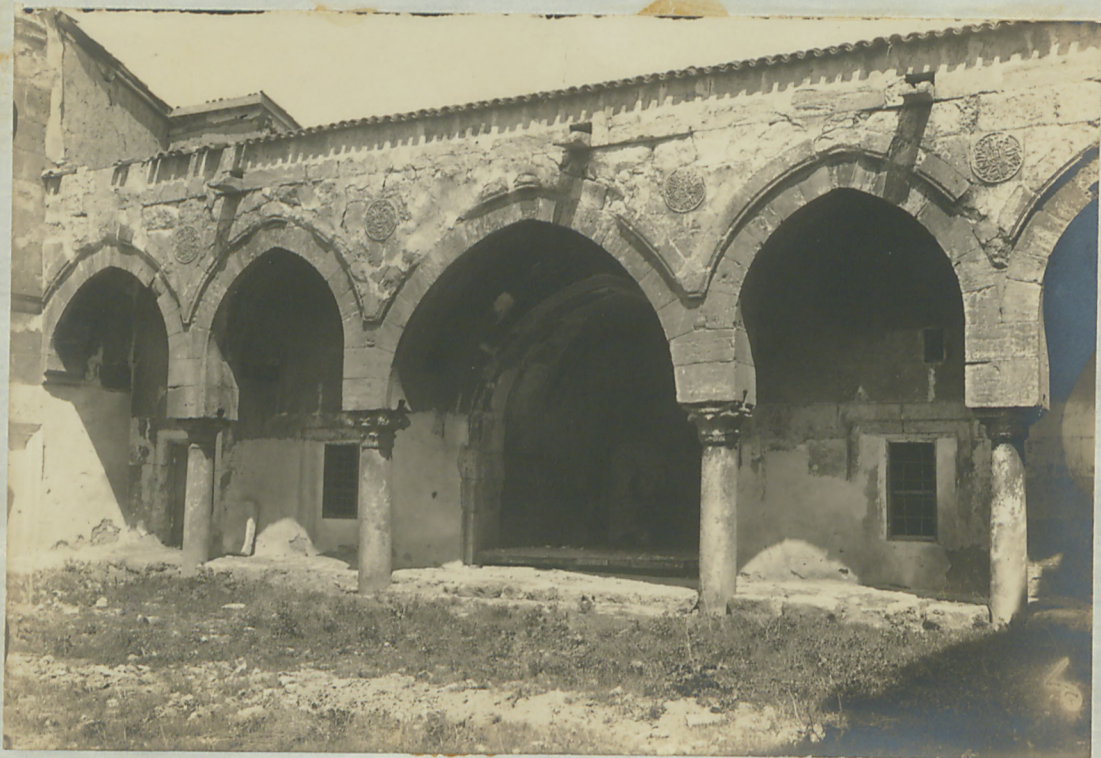
یواسی : بردیکه مدرسه دافنده بم ۱۹۰۴