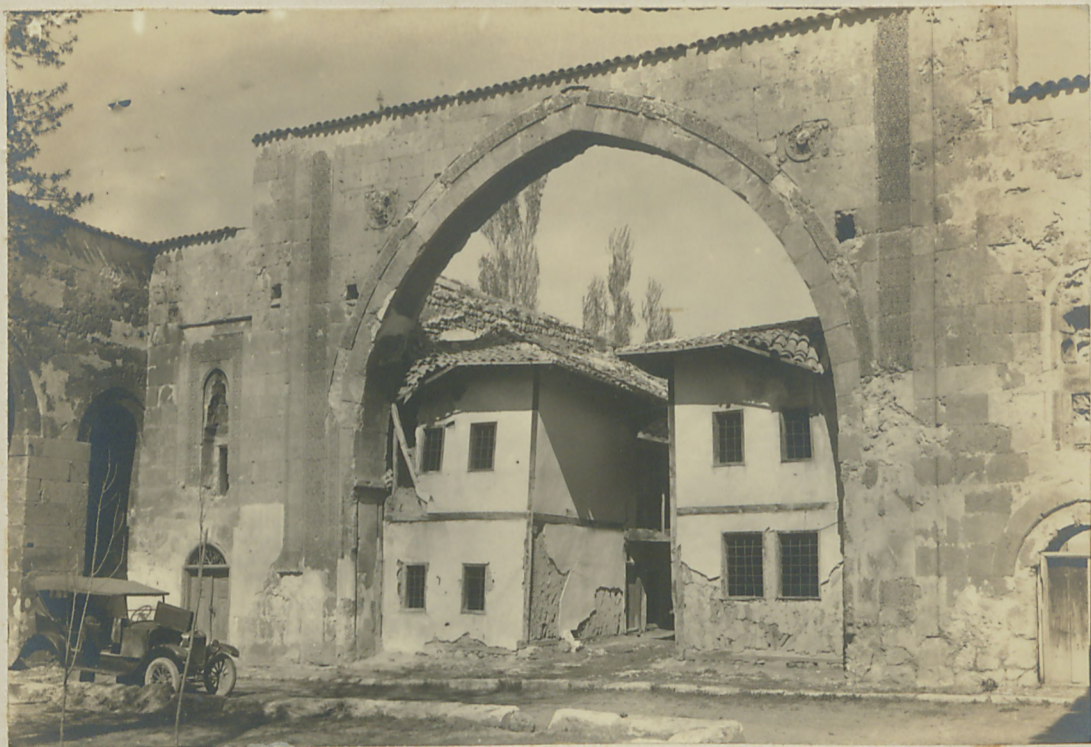
سوان : صفایه بنامی دهنده بریاریم ( رفوع دارالرس زبوره مدرسه متروک اقاب لیه مدرسه اطلالی )