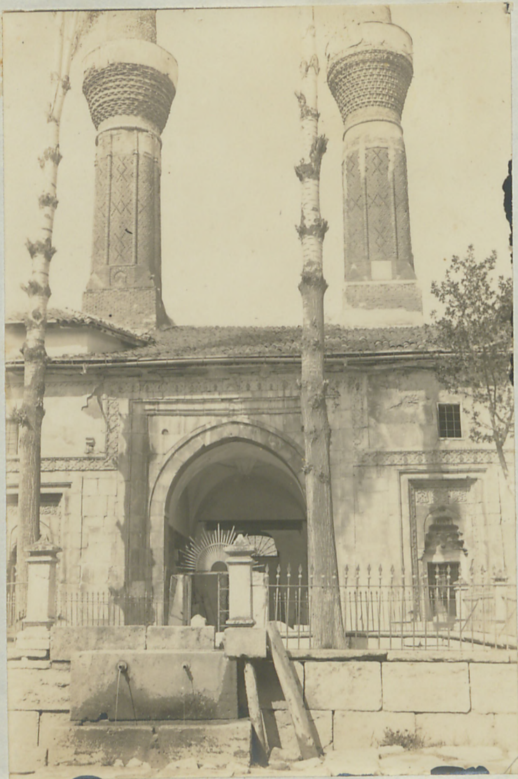
سیداسی : کورده سردر بے صفاه لکریه راهدره برنظ