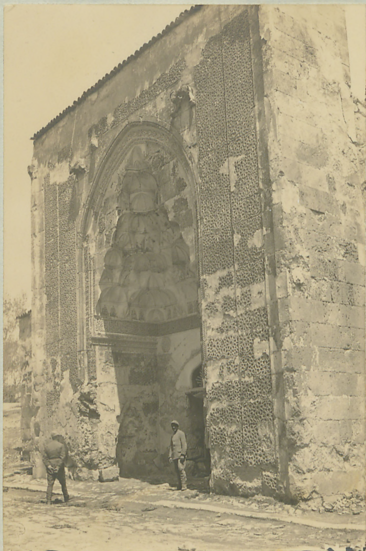
پیرس = حقه صاره تارکون سفایه نام ناتک صنع قایسی