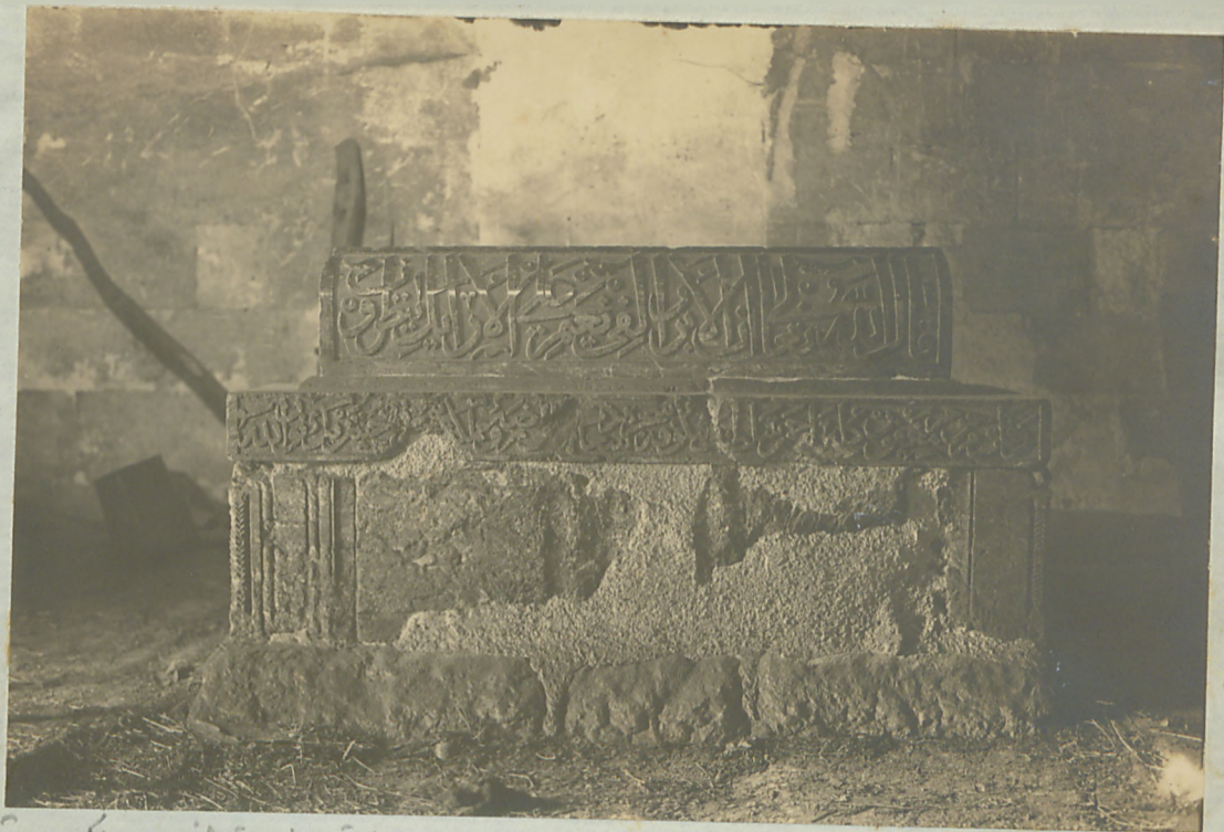
بیواس : کو درک شماره دانشه ( ۷۶۸ ) تاریخ قبایله صومالیه ص ۳۳ موضوع طه