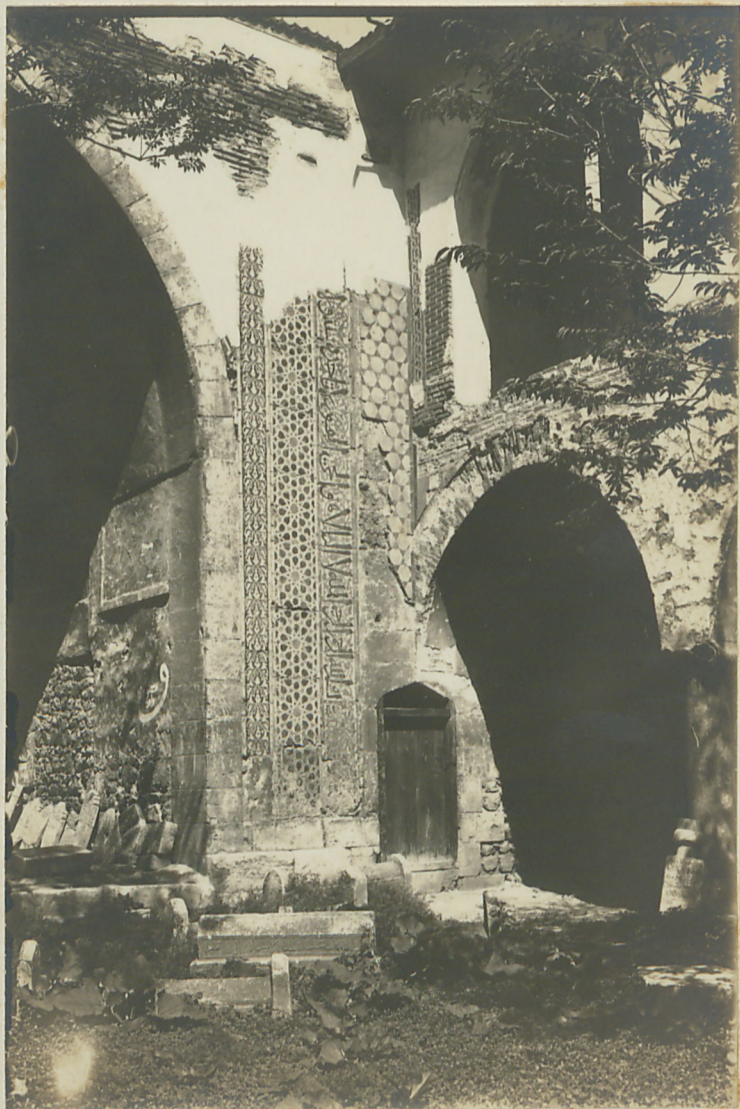
توقات : بوزه آغار اییلده کون مدک تک چیلرک مهن اسم راحه شده بریاره