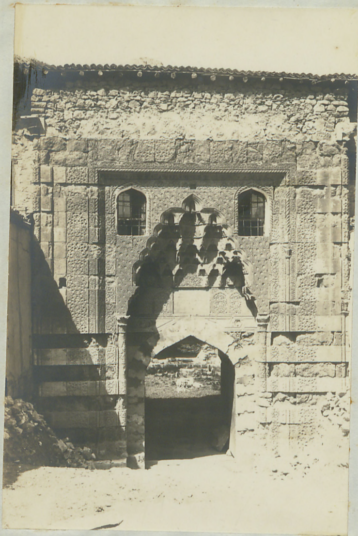
توفات : موزه آثار ایدیلانه کون مدرسه سن مصنع قاسمی