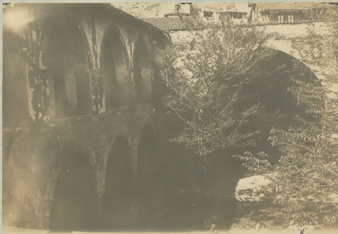
توقا : کولک مدرسا دن هولی قسندہ برنامہ