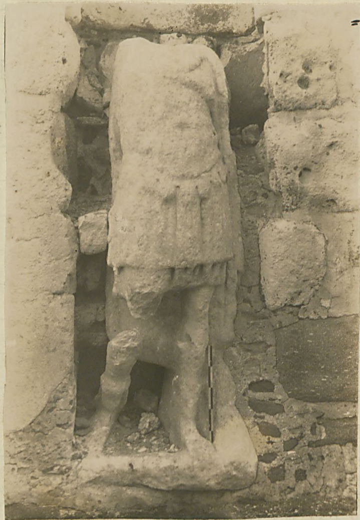
۱۰ - ای قلم دروننده هم برهیکل .