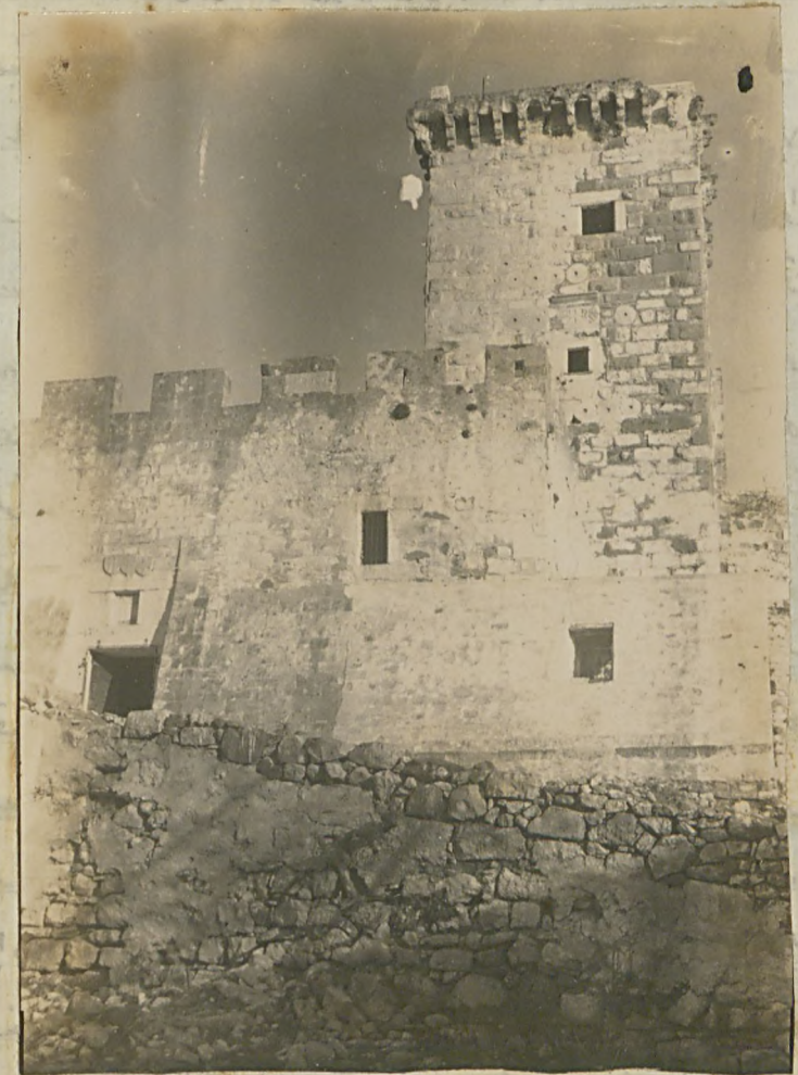
لیج قعه ده هوشی بر کجه و بر نه قیالی

کجی صارتده عددی بکده ایکی یوزده دارانه آهیلده نزارلرک هوشی - هتی کوزلی قیالی اطلارینه غمنا - نهی بولمدر . ناز علی ، محتویاتی هفنده بیانه خدایله هفیاتک نردم اجاسده توقفده اصابت اولمار . موهذا ، برتونه قصه خلقی آراسده سیوع بولانه برمکون مدفنک آهیلی ده هاندر بر طرفده مدفنک قصه یقیه دکنر کا هده بونسی دیک طرفده عیالیله کونده متوقف اولی برانسن هالیله محتاطنده برمکون متصور اوطارینی مفوضنده هلو تسخیر ایله مطایبه قالمدر . برنا سبله هفیاتک سنه آتیه برکنده بر باسه یوقدر . کیفیت مناسب کور و لویله تقدیرده وقت دهکنز ازیر موزه سنه اولی اوج لرتک یوز لیرا مضیله یابیلر هفیاتک اداره سی در عهده ایضه مباهی اولورم