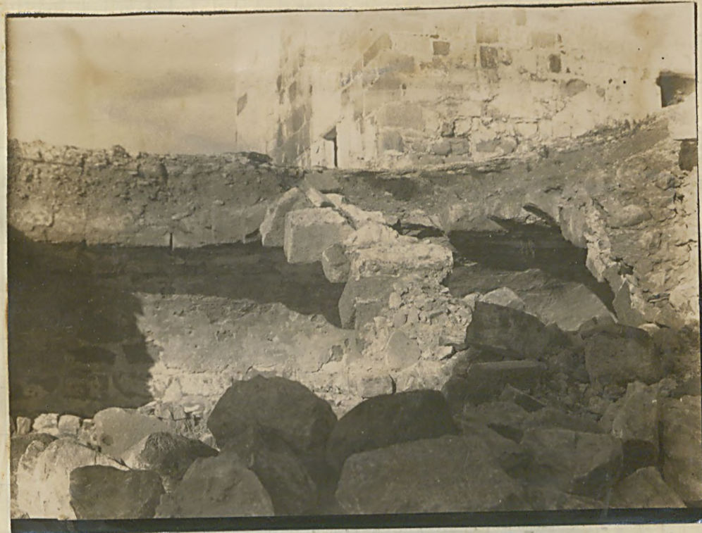
حرب عمومی به بمباران مانده نتیجه خانه اولاد ایچ قلم دره بر قسم