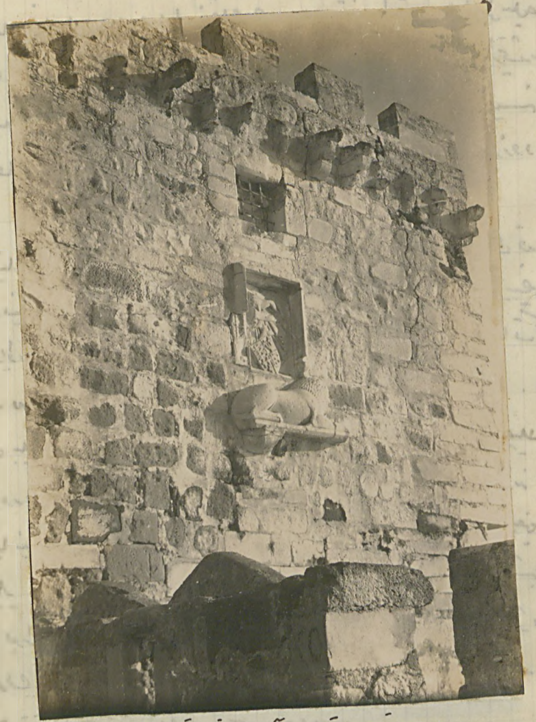
ساحله يقيه موقعه آرسلانى قوله . (۵)