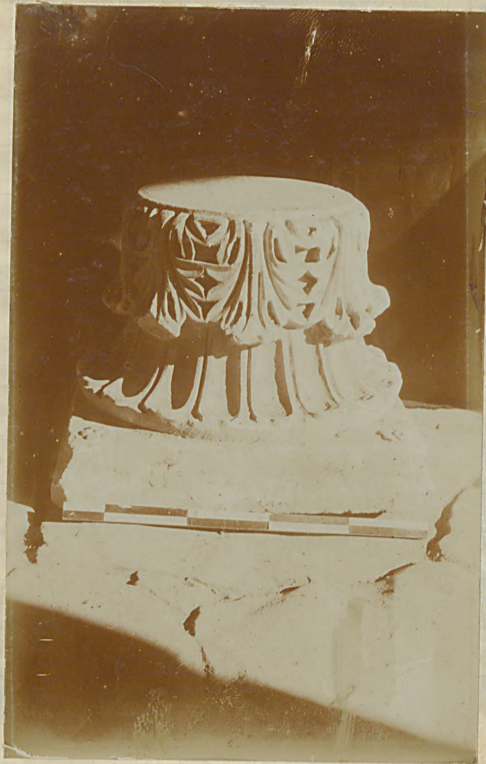
ستون باسیلیس (ب)