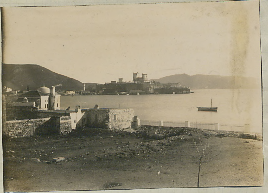
هالیقارنا سوسک ایچ لیمانی و بودر و رم سهر لری .

غریب آناطولک ساهلرند ه لطافت موقعه سیه معروف قصبه لرونه بری ده بودر و صدر . استانبولی اله سنک قار سوسنه اطرافنی بر تیاتر و غره و ندرنی الیور صورتده هفتیف بر میل ایله یوکلسه داعلره محاط واورته سنده ایماندنی زینه ایدنه ایریلی او فاقلی بیاصه و کار کیم مبانیه لطف بر منظره عرصه ایدنه بودر و دره ، ایمانه زحل اولور کیم زار سنک ان اول نظر قوی حلب ایدنه بنا ، ایچ لیمانی قار و سیدانه هیقینتیک صانع طرفونه ک قیاس اوزرینه قورولو مهارور . راورم ، ساتو و ستملائی ایله ایالتی لیک طرفنده ابراقناه هفتیان هفتده کی تحقیقات و عملی الخضره بودر و سیاهتمه ریله تکیل ایدنه کسوف منقنه معلومه تدقیقاتی احوال ایدنه هفتده بوتاریجی قصبه ده ایوم ایزلری باق قالمیله مبان خراب لرینک لطفی بر صورتده ذکریله الف اولنه هفتده . قاریا هفت قریب سنک یا تخی میلائی ایله هالیقارنا سوسک لطافت موقعه سنه انضمام ایدنه طبیعی متکلم و مدافعه الیور تیلی بر موقع ادلی و دیگر طرفنده تجارت موافقه بر لیمانی بولونسی نفر هفتده میلاسنه بورام بقده تا ز کلسه رموز و لوسسی یا تخی بر اوره قور و قدیم صوکر استدی عماره با سلاسه ایدی . زانا بوراسی ، بر صیفیه مقانده ایدی و برونه بویله ده معبد ، ساری ، تیاتر و ، آغور کچی مبان ایله سهر زینه طبیعی ایدی . لکنه هالیق قصبه ده سهر قدیم عامه منور کاتنه هکیمه اثر قالمسه کبیده . دیک قدیم سهر لرن انقا سنده آرز رهبره بر قلمر آلموه مکانی اولدنی هالده هالیقارنا سوسه عجایب عالم هرده سنه کیمه واسی مؤلفه بر بوترونه دنیا نیک هیرت ایدنی بر اثر اریسنه اوزره طابقی بر بلاه " موزوله کوم " ک سیه برنی قصبه ایتمک بد ک لهره