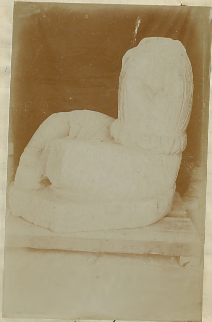
• اردو پورسہ کھیل (بالکندہ)