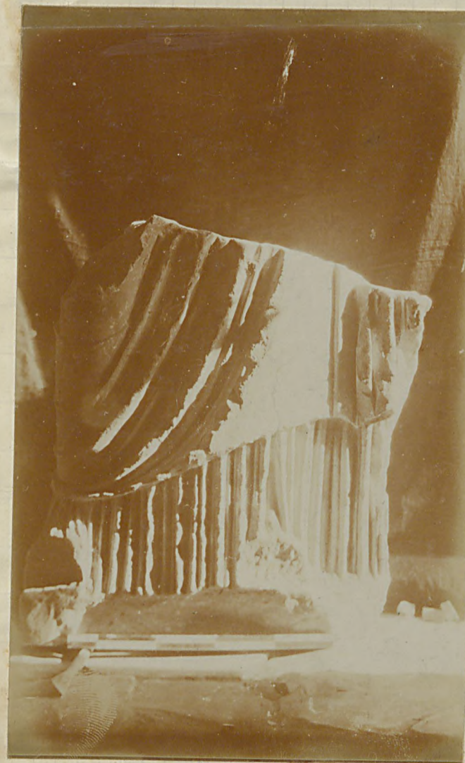
سپهر برکھیلک قسم ستون (ج)