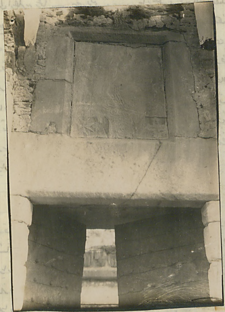
قارزیال قاسیسی اوز زنده محکور عدلی به عائد طفرای