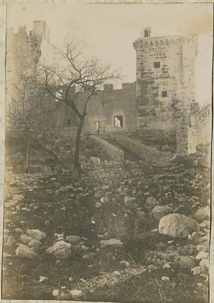
بودوم قلم لرزه ! حقیقه قول . (۱۰)

restaurée Springer Urmé Antikament acrotère Char