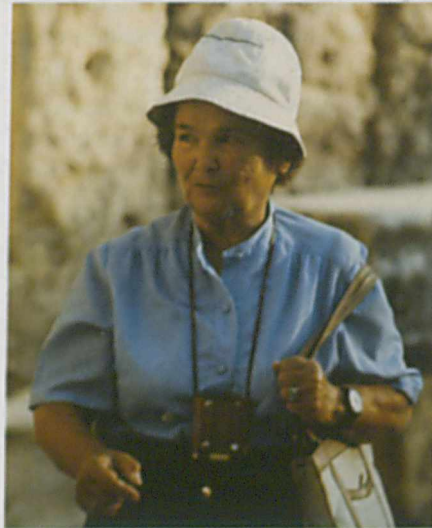
Jale Inan, emekli olduğu 1983 yılından sonra da, ilerlemiş parkinson hastalığına rağmen çalışmalarına devam eder. Bu dönemde, yaptığı araştırmaları yayına dönüştürmeye ve tasarladığı kitapları yazmaya çalışır. Bu da zaten kabarcık olan hazırladığı bilimsel makale ve çevirdiği ya da yazdığı kitapların listesini daha da kabartır.

1983 yılında emekli olduktan sonra daha etkin bir araştırma yaşantısının içindedir Jale Inan. Gerek eski çalışmalarını değerlendirmesi, gerekse yeni araştırmaları gündeme getirmesi bakımından oldukça verimli bir süreci ya-