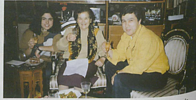
Uzun süre birlikte çalıştığı kazı ekibi (solda), oğlu ve torunuyla birlikte, sekseninci yaş gününü kutlarken.