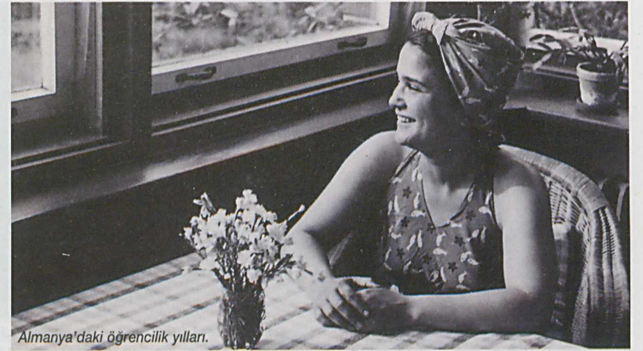
Almanya'daki öğrencilik yılları.