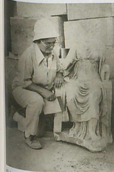
Side ve Perge'de yaptığı kazılar yarım yüzyıla yakın bir süre devam etmiş, sayısız tarihi eser de bu sayede gün ışığına çıkarılmıştır. Bunların yanı sıra, düzenlediği kurtarma kazılarıyla pek çok tarihi eserin yurtdışına çıkarılmasını önlemiştir Jale İnan. O hiçbir zaman bir masa başı arkeoloğu olmamış, arkeolojinin arazide yapıldığına inanmıştır.

Ülkemizdeki en büyük heykel kazılarının çıkarıldığı Side ve Perge'de yaptığı bu kazılar, özellikle ilk 25-30 yaşlarında yöre halkı için de önemli bir gelir kaynağı oluşturur. "... çok da fakirdi.